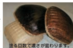
塗る回数で濃さが変わります。

●木材に塗装すると、木材の表面に強固な塗膜を作らず、木材に浸透することで木材の通気性が保たれ、木目の美しさが引き立ち、自然なツヤと風合いがつけられます。